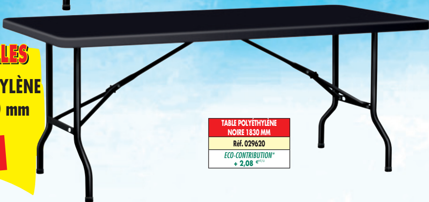
TABLE POLYÉTHYLÈNE NOIRE 1830 MM Réf. 029620 ECO-CONTRIBUTION* + 2,08 € HT