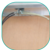
Poignée de réglage