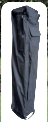
Sac de transport, consultez-nous

ABRI FESTIF M2 3 X 3 M COMPLET* Réf. 010441